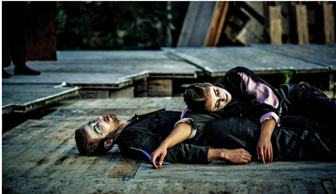
Auch für die Aufführung von Romeo und Julia in der Tonhalle Wil gab es in der Vergangenheit Lotteriefondsgelder.